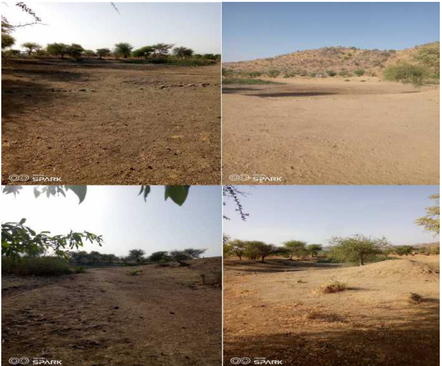
Imágenes de los charcos de Ouzal tomadas el 15 de abril de 2021