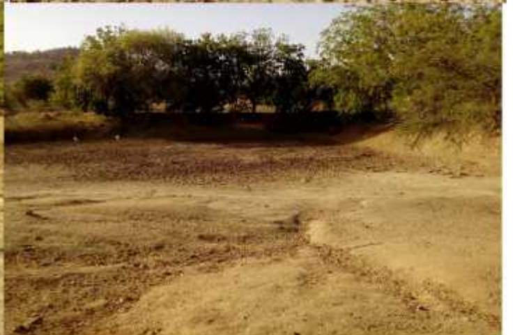
Imágenes de los charcos de Mandoussa tomadas el 16 de abril de 2021