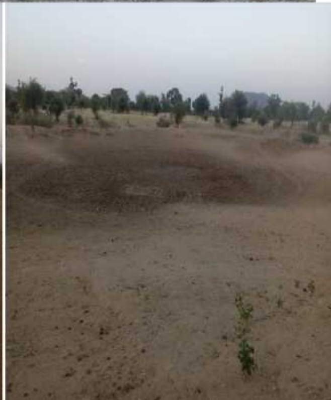
Imágenes de los charcos de Modoko tomadas el 16 de abril de 2021