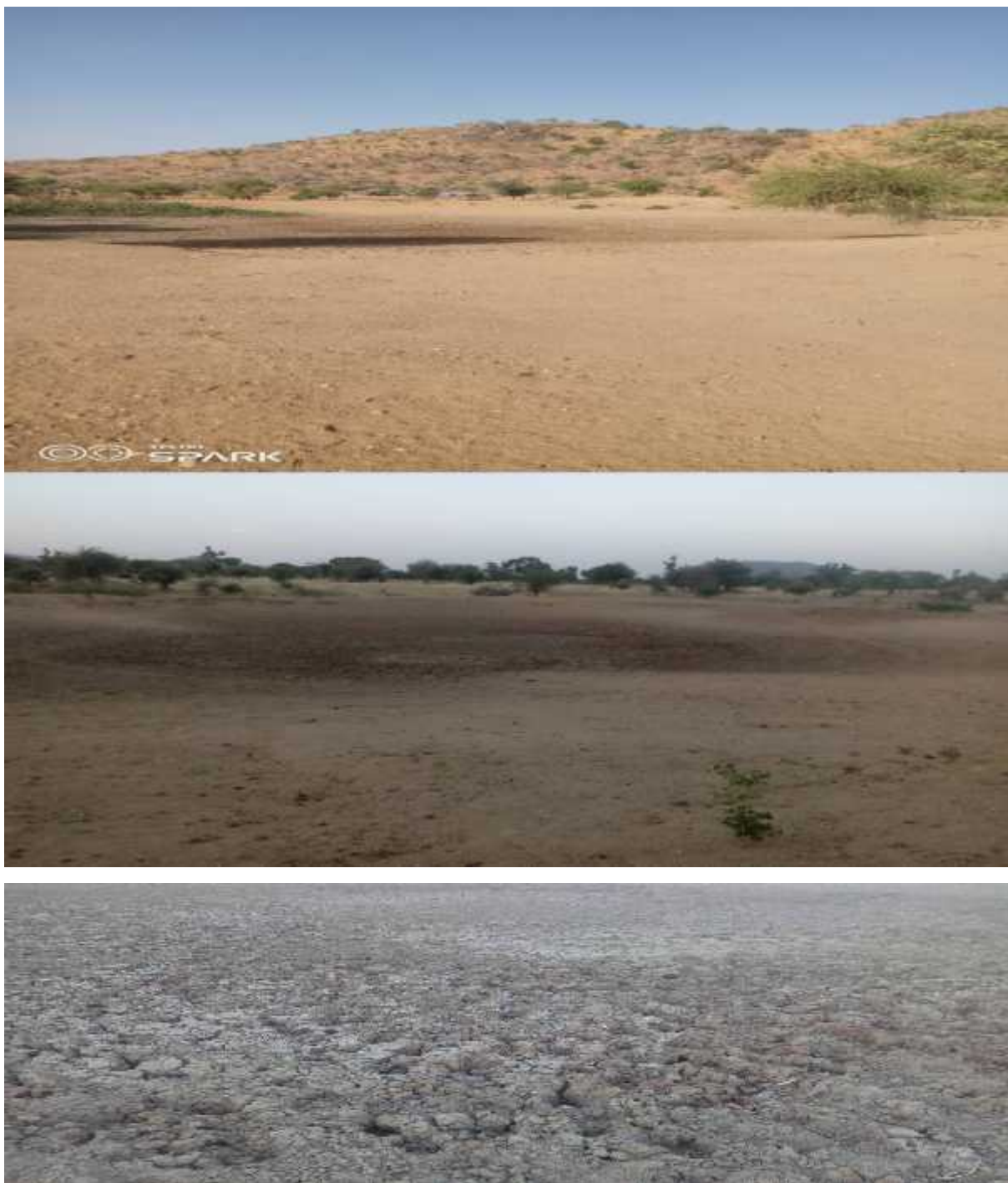
Fotos de tres charcos de agua